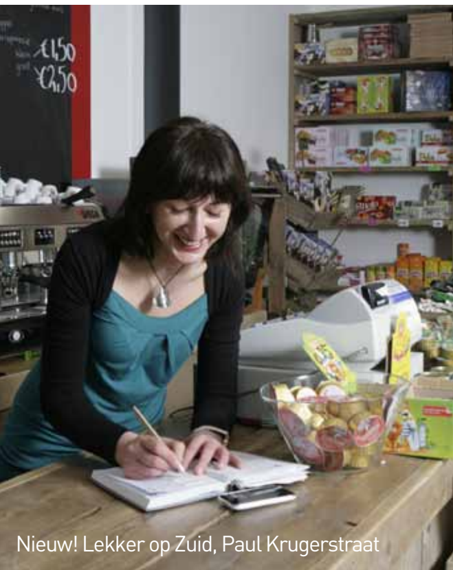
Nieuw! Lekker op Zuid, Paul Krugerstraat