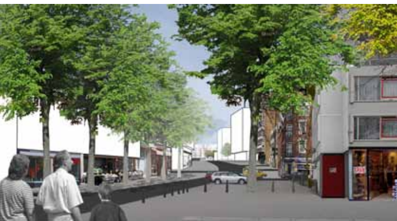
Route Paul Krugerstraat - Laan op Zuid