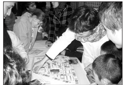
Het spel wordt gespeeld met jong en oud

De deelgemeente Feijenoord en Vestia hebben het ontwikkelen van dit spel gesubsidieerd. Middenstanders hebben aardige prijzen voor de winnaars ter beschikking gesteld. Het is de bedoeling dat dit spel het komende jaar op verschillende plekken en met verschillende groepen gespeeld