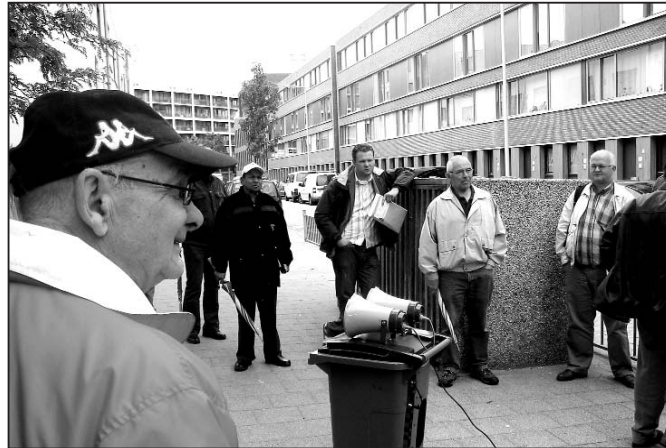
Bewoners die samen onveilige verkeerssituatie bekijken

Kinderen en volwassenen vinden de verkeerssituatie in de wijk onveilig. Daarom zijn zij op pad gegaan en hebben een aantal gevaarlijke situaties gefotografeerd. In maart is hierover een gesprek geweest met het bestuur van de deelgemeente. Er werden toen een aantal toezeggingen gedaan waarover we in de krant van april schreven.