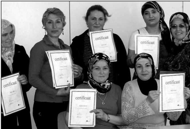
Dames met hun certificaten die geslaagd zijn voor hun fietsexamen

Oproep: goede, bruikbare fietsen zijn altijd welkom, want er staan veel cursisten op de wachtlijst.