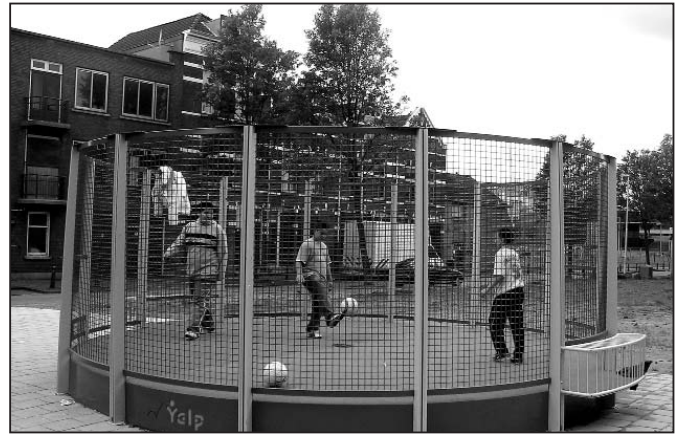
Jongeren spelen veilig in de pannakooi

Hij stond er zomaar in eens, aan de Paul Krugerstraat. Maar wat is dit, wordt al volop gebruik van gemaakt! zullen sommigen zich afvragen. Dit