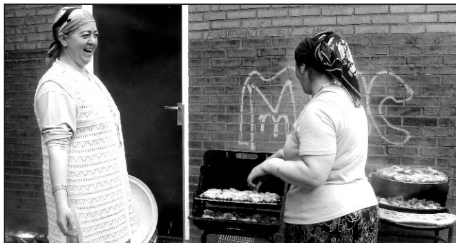
De voorbereidingen voor de BBQ, met een stuk of zes buurvrouwen