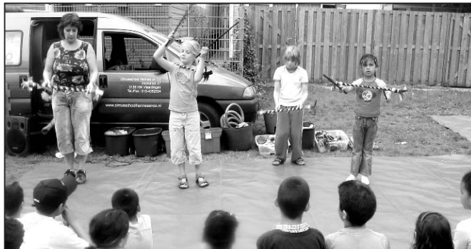
Het slotoptreden van de kinderen voor eigen publiek