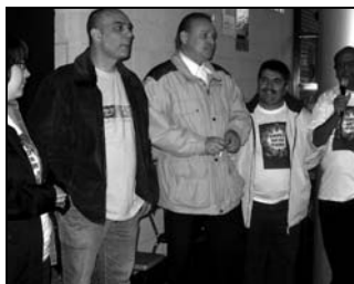
Raadsleden in Chr. de Wetstraat

Dinsdag 29 mei was het de Europese dag van de burenen . Deze dag komt voort uit het Opzoomeren , waarbij burenen met elkaar hun straat schoon, veilig en gezellig willen hebben. Ook worden er straatfeesten georganiseerd met elkaar. Op deze manier leer je je buurtjes beter kennen en zijn er sociale contacten. Het is de tweede keer dat de Europese dag van de burenen in de Afrikaanderwijk plaatsvindt. Vorig jaar werd de dag in de Herman Costerstraat gevierd. Die is ook dit keer weer van de partij, samen met de Christiaan de Wetstraat.