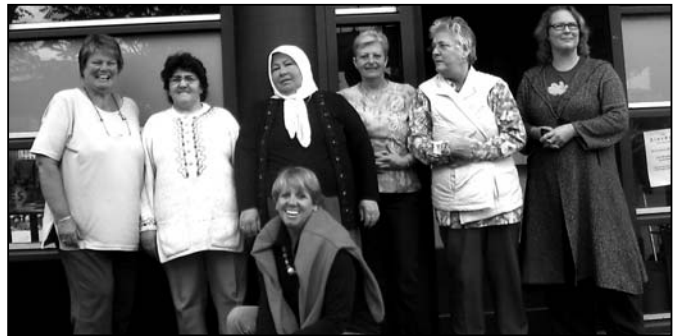
Vrijwilligers van het Wooncafé

Ideeën voor een nieuwe naam? Stuur deze naar de redactie van de BOA-krant: boa@afrikaanderwijk.nl . Even binnenlopen bij de BOA aan de Hilledijk 81, is natuurlijk ook niet verkeerd. Dan krijgt u er een kopje koffie of thee bij.