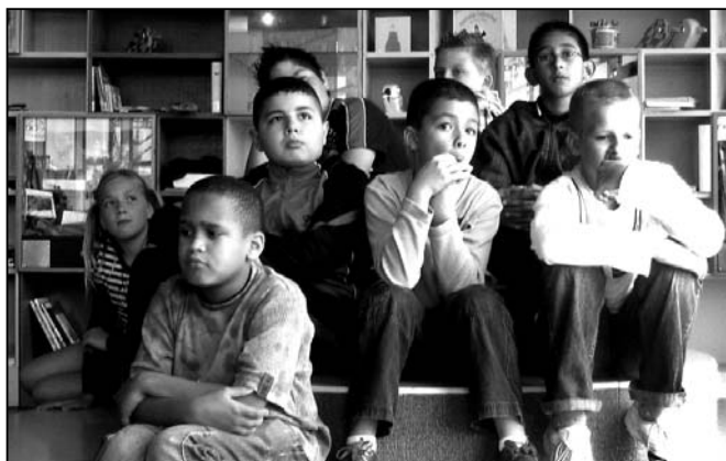
De kunstkanjers applaudiseren voor de aanwezigheid van ouders en andere belangstellenden. Vanzelfsprekend volgde daarna het applaus voor de kunstenaars zelf.

De leerlingen hebben een Kunstkanjerbeurs gekregen van Vestia. De woningbouwcorporatie investeert op deze manier in de jonge bewoners van de Afrikaanderwijk. Met de beurs kunnen zij hun creatief talent verder ontwikkelen. Deze keer zijn de kinderen aan de slag gegaan met verf en penseel. Samen met een kunstenaar hebben ze schilderijen gemaakt over de planeet Trilala. Een planeet waar alles anders is dan op aarde. De lucht is paars, de bewoners zijn half mens, half dier en hebben vreemde hobby's.