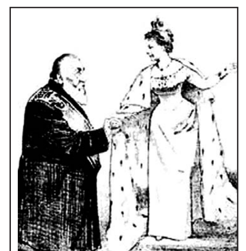
Paul Kruger-koningin Wilhelmina