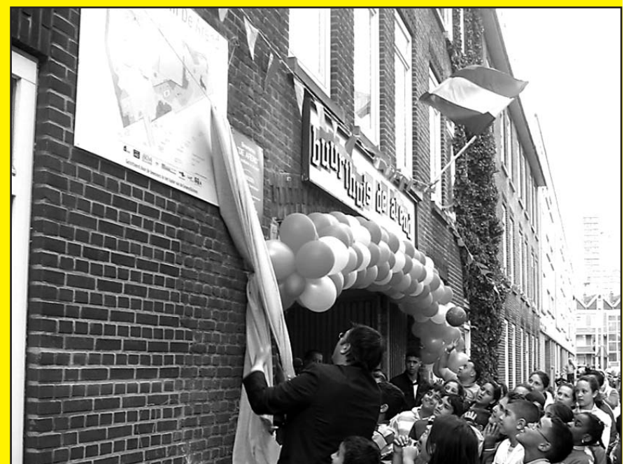
augustus - onthulling bord Arend