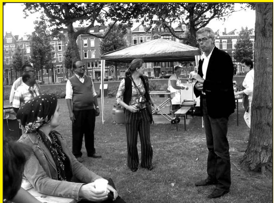
juni - presentatie pleinparasol