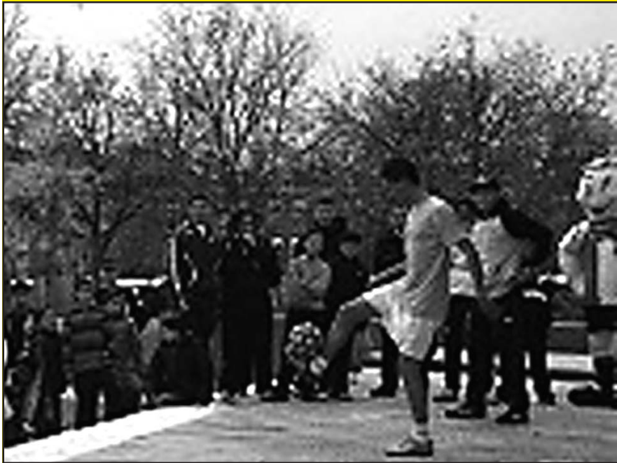
mei - presentatie voetbalschool