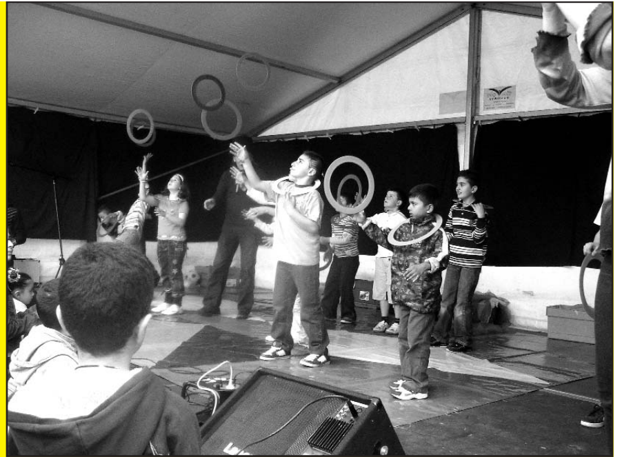
april - internationaal kinderfeest