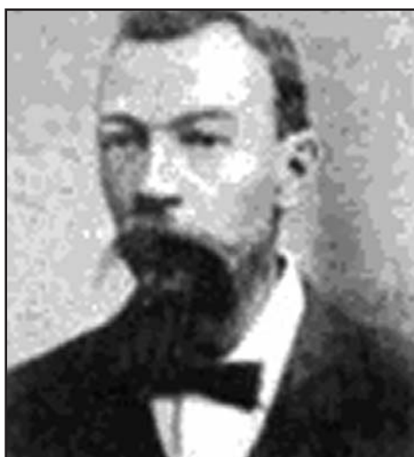
Schalk Willem Burger

Schalk Willem Burger leefde van 1852 tot 1918 en was Generaal van de Transvaalse Republiek. Na het vertrek in 1900 van President Paul Kruger naar Europa was hij waarnemend staatspresident van de Transvaalse Republiek.