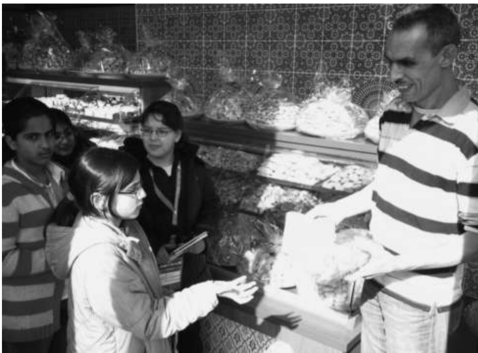
De metamorfose van Bakkerij Fes. Door het Kinderpersbureau

Burgemeester Aboutaleb bracht pas een bezoek aan bakkerij Fes. Ging hij er koekjes kopen? Misschien, maar in ieder geval kwam hij de bakkerij officieel openen. Bakkerij Fes is namelijk helemaal verbouwd. De Afrikidz van het Kinderpersbureau gingen er een koekje proeven... euh ik bedoel een kijkje nemen. Want waarom is de bakkerij eigenlijk verbouwd en wat is er allemaal veel mooier geworden?