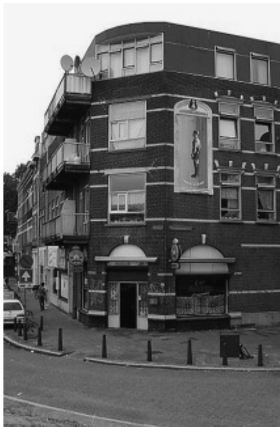
De hoek Bloemfonteinstraat 1949 en nu.